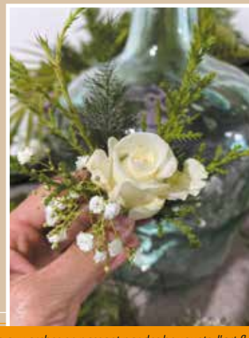
Du mannequin aux arches en passant par des bouquets, l'art floral n'a pas de limites