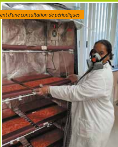
Traitement d'une consultation de périodiques