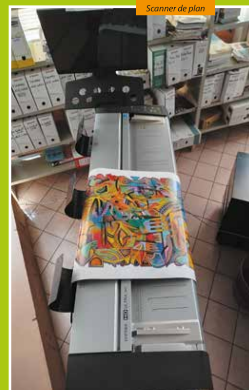
Scanner de plan

« L'acquisition d'un nouveau serveur et d'un backup permettra de conserver et sécuriser davantage d'archives numériques, de réorganiser nos bases de données et de mieux structurer nos fonds audiovisuels, iconographiques et bibliographiques. Nous prévoyons également la numérisation d'archives sur supports spécifiques (cartes, affiches) grâce à un scanner de plan, qui nécessitera, outre un investissement financier important, une formation préalable des agents. » ♦