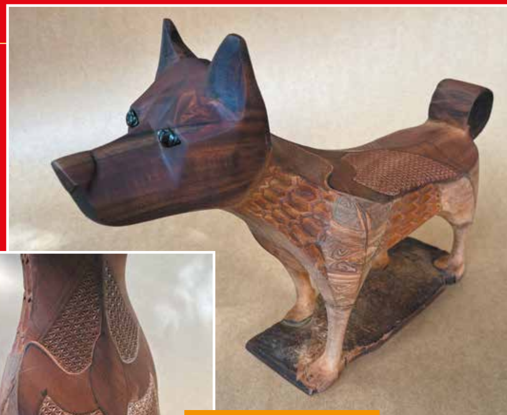
Animal tutélaire, Pi'ihoro a été créé et sculpté par le CMA pour l'exposition universelle à Osaka