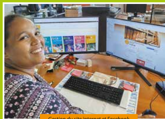
Gestion du site internet et Facebook

« En 2024, par exemple, nous avons accueilli trois fonds dans le cadre de dépôts révocables. Nous veillons à bien vérifier que ces dépôts aient un intérêt patrimonial avéré, la légitimité du dépositaire sur le fonds déposé et en contrepartie de la conservation, et avec son accord, nous procédons à leur numérisation et valorisation. »