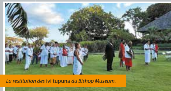
La restitution des ivi tupuna du Bishop Museum.

Depuis deux ans, la Direction de la culture et du patrimoine (DCP) s'est engagée activement dans une démarche de collaboration avec plusieurs institutions muséales internationales en vue de rapatrier les ossements humains de Polynésiens, ivi tupuna . Ces restes, parfois prélevés de manière illégale, ont été intégrés dans les collections de musées étrangers au cours du siècle dernier. L'objectif de ce projet est double : restituer ces ossements à leurs communautés d'origine et les réinhumer dignement sur leurs terres ancestrales.